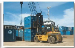
항만 해운 물류