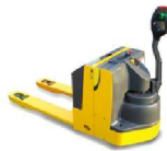
전동파렛트 트럭 1.3톤~2톤